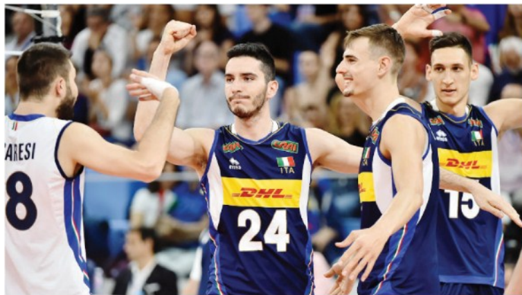
Daniele Lavia, 19 anni, Simone Giannelli, 22 anni, Roberto Russo, 22 anni