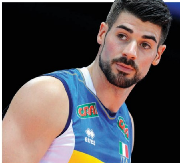
Filippo Lanza, 28 anni, pallavolista della Nazionale italiana